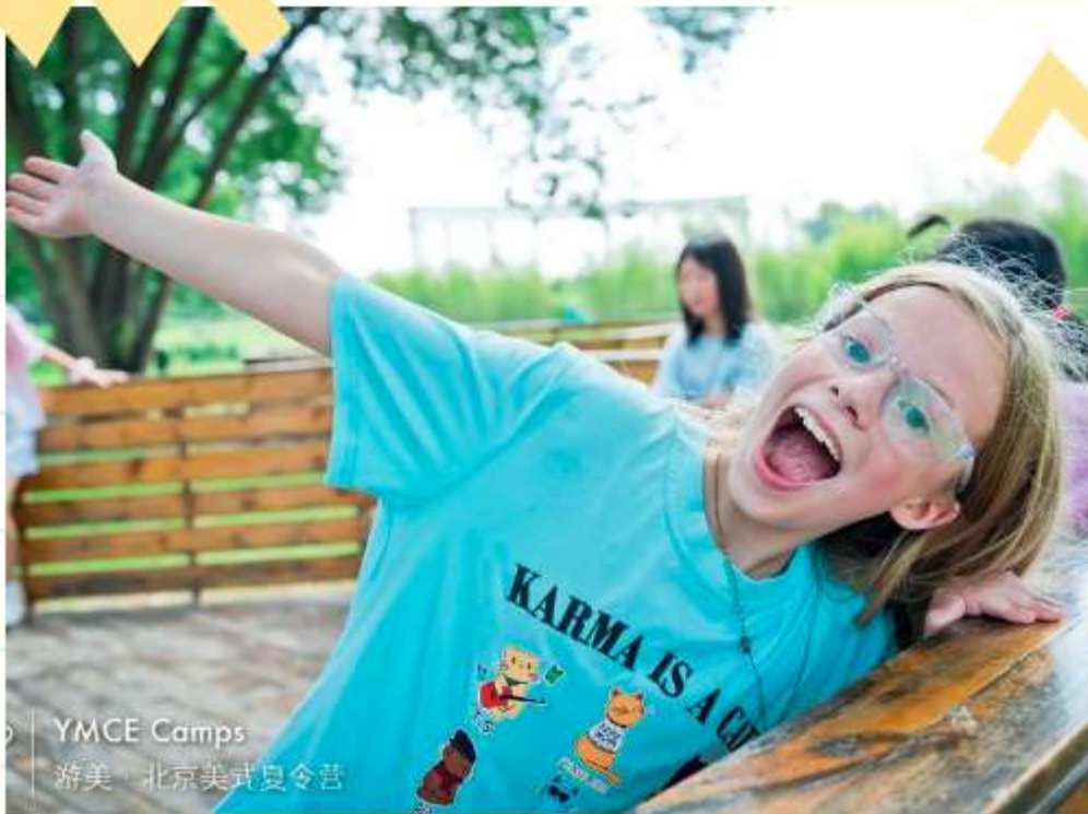
YMCE Camps 游美·北京美式夏令营

Традиция летних лагерей уходит корнями в конец XIX века, когда идея развития личности через общение с природой стала популярной.